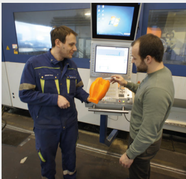
Konsultation anhand eines 3D-Modells