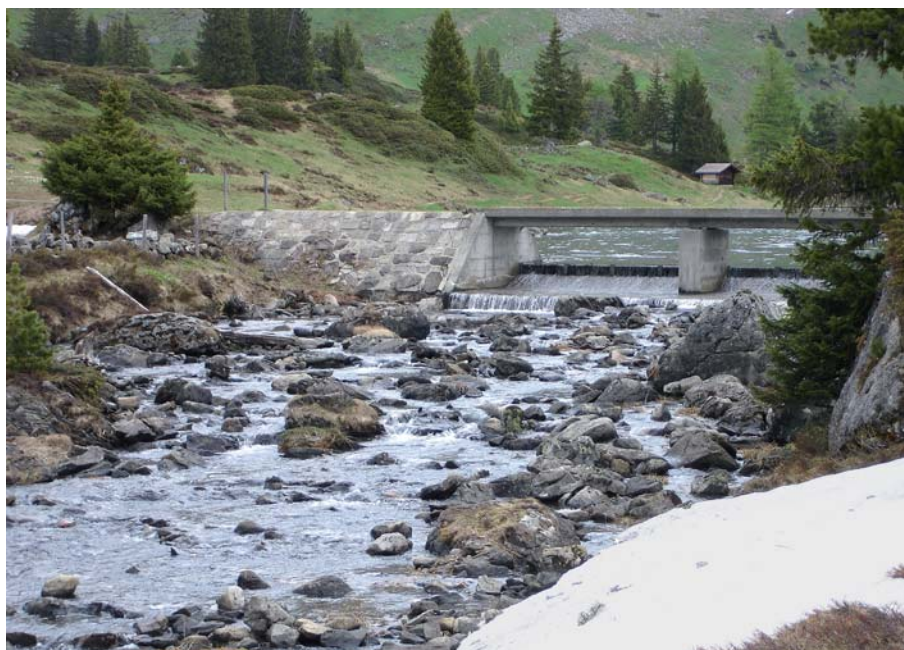
Bild 2. Reaktivierung des Ausflusses vom Engstlensee als landschaftliche Aufwertung.

ist auf die Dotierungen an den Fassungen Wenden, Stein und Führen abgestimmt, wodurch der Oberlauf des Gadmerwassers künftig wieder als zusammenhängender Lebensraum für Bachforellen zur Verfügung steht. Der Fischabstieg wird in die Massnahme integriert.