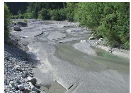
Bilder 5a bis 5c (vlnr). Illustration von dynamischen Prozessen in der Aue Obermad mit Fotos vor (Bild 5a; 05.06.2009), während (Bild 5b; 18.06.2009) und nach einem Hochwasser (Bild 5c; 25.06.2009). Mit der Auen- und Flussrevitalisierung Obermad werden diese dynamischen Prozesse grossflächig in dieser künftigen Auenlandschaft angestrebt.