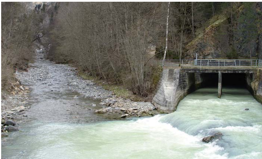
Bild 3. Unteres Gadmerwasser bei der Wasserrückgabe vom Kraftwerk Innertkirchen 1. Mit der künftigen Verlegung der Wasserrückgabe (unter dem Gadmerwasser hindurch) und einer weiteren Erhöhung der Restwassermenge steht dieser Gewässerabschnitt (links im Bild) künftig als Laichstrecke für die Seeforelle wieder zur Verfügung.

Schwallstrecke der Hasliaare abgedämpft (Schweizer et al. 2008). Ausserdem soll mit einer damit verbundenen Verlegung der Wasserrückgabe der Unterlauf des Gadmerwassers wieder für Seeforellen zugänglich werden. Heute wird das Triebwasser vom Kraftwerk Innertkirchen 1 in den Unterlauf des Gadmerwassers geleitet und so das Einsteigen der Seeforellen in diesen Gewässerabschnitt verhindert (Bild 3). Künftig wird das Triebwasser unter dem Gadmerwasser in das Beruhigungsbecken geleitet, so dass der Unterlauf des Gadmerwassers für die vom Brienersee kommenden Seeforellen wieder erreichbar ist und so wertvolle Laichhabitats von der bedrohten Fischart wieder genutzt werden können.