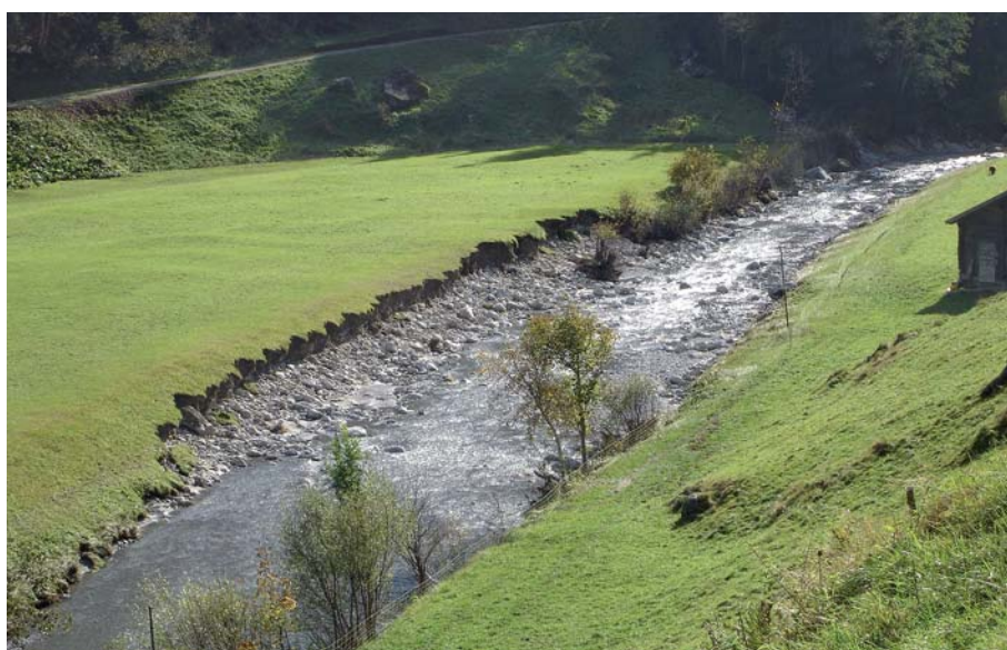
Bild 4. Ansicht auf den unteren Abschnitt der künftigen Flussrevitalisierung Fuhren-Süd. Das Hochwasser vom 10.10.2011 hat bereits erste ökologische Arbeiten in diesem Abschnitt vorweggenommen.

dere für Seeforellen, Groppen und Bachforellen, erwartet. Zusätzlich werden bei der Planung die Lebensraumansprüche von Eisvogel, Amphibien und Reptilien berücksichtigt.